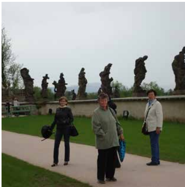
Zájezd 12.5. Kuks