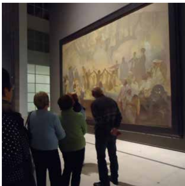
Zájezd Praha - Muchova Epopej