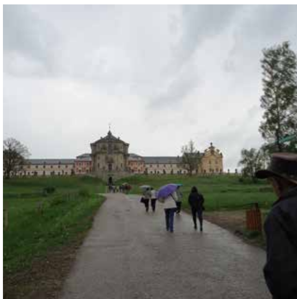
Zájezd 12.9. Kuks