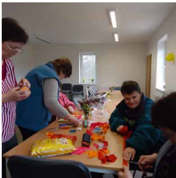
Setkávání důchodců v klubovně - výroba velikonočních kraslic