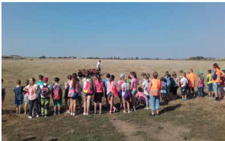
Višňovská škola v Ostrově