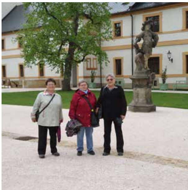
Zájezd 12.9. Kuks