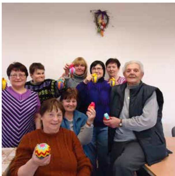
Setkávání důchodců v klubovně - výroba velikonočních kraslic