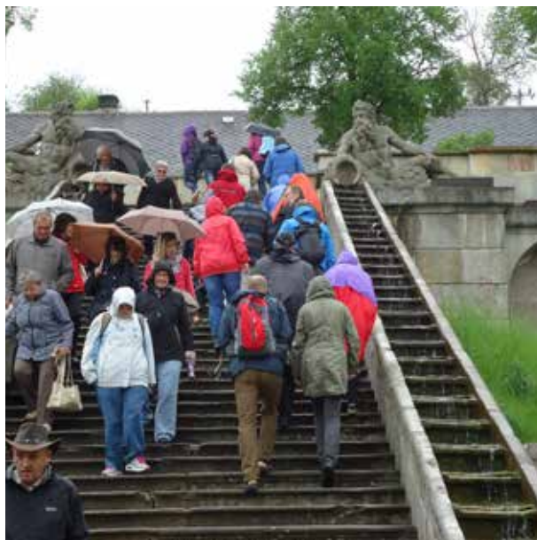
Zájezd 12.5. Kuks