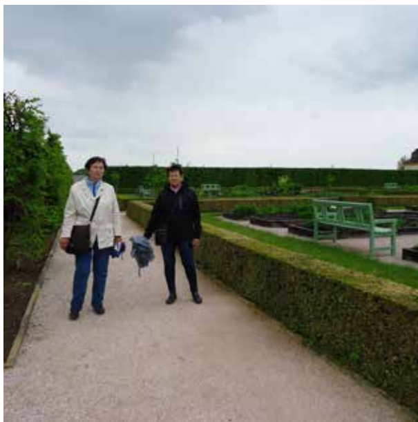
Zájezd 12.5. Kuks