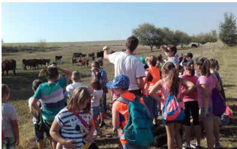
Višňovská škola v Ostrově

K návštěvě jsou zváni všichni zájemci – malí i velcí.