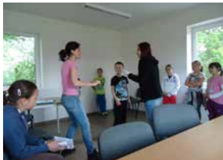
Zkoušky na divadelní představení