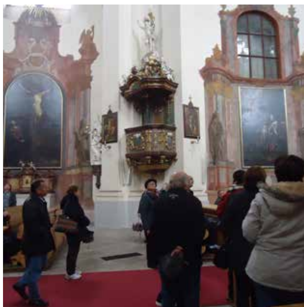
Zájezd Praha .Břevnovský klášter