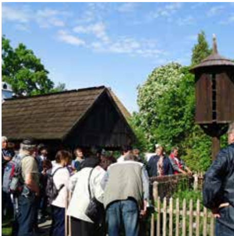
Zájezd 12.5., skanzen Přerov nad Labem