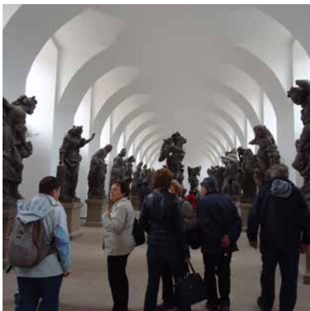
Zájezd 12.9. Kuks