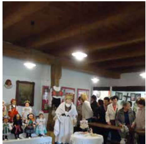
Zájezd 12.5., skanzen Přerov nad Labem