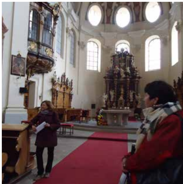
Zájezd Praha, Břevnovský klášter