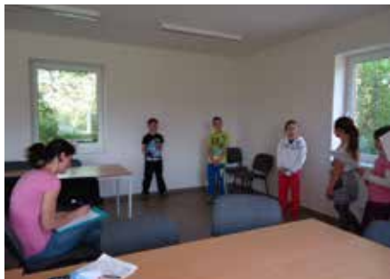
Zkoušky na divadelní představení