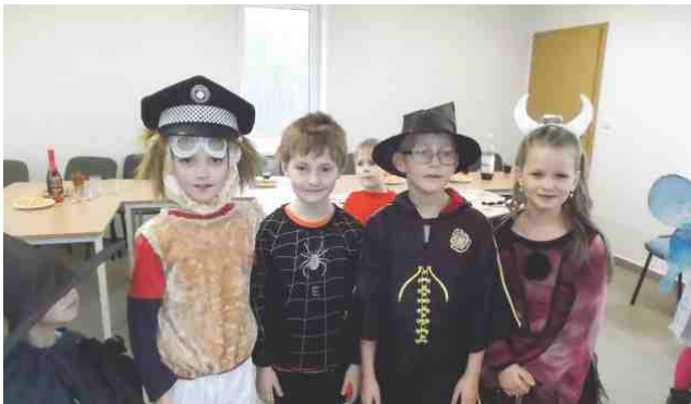
Dětský maškarní ples