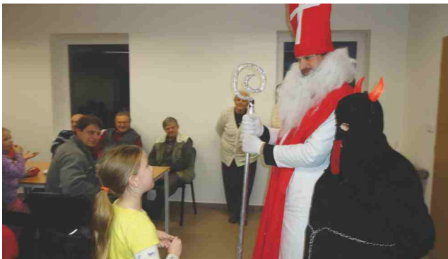
Mikulášská besídka 2014