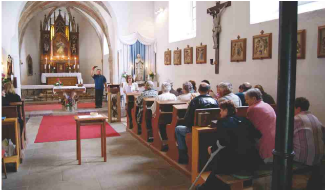
Setkání rodáků, návštěva kostela ve Višňové