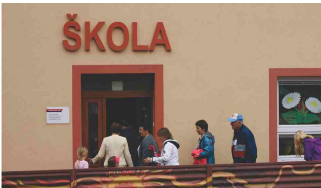
Setkání rodáků, návštěva školy ve Višňové