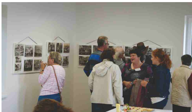
Výstava starých fotografií v klubovně