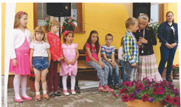
Vystoupení dětí na setkání rodáků