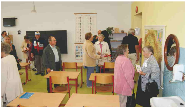
Setkání rodáků, návštěva školy ve Višňové