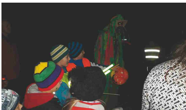
Lampionový průvod 2014