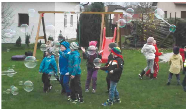
Lampionový průvod 2014