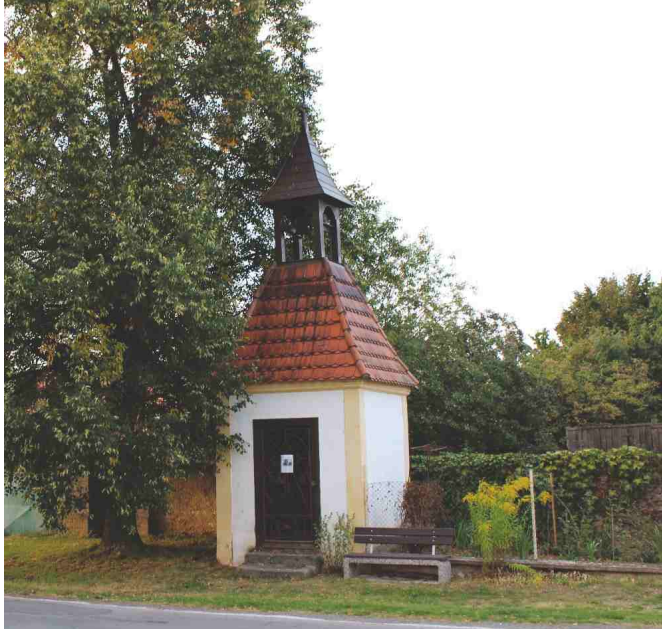
Kaplička v Ostrově