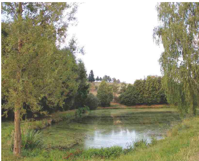
Obecní rybník na Chaloupkách