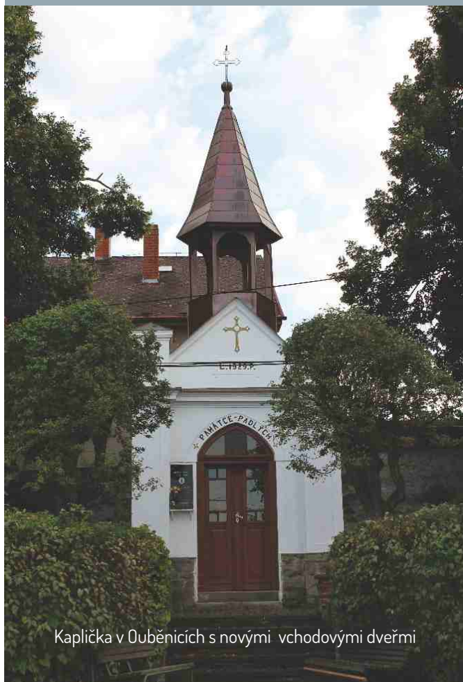
Kaplička v Ouběnicích s novými vchodovými dveřmi