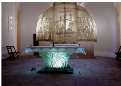
Zájezd na Šumavu 2019