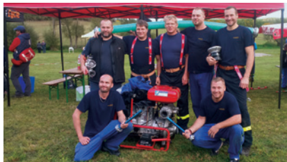
Soutěž v Libčici