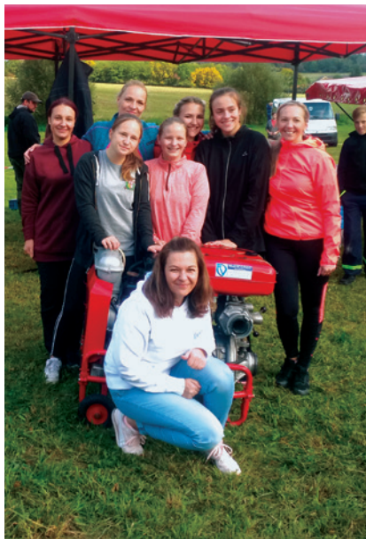
Soutěž v Libčici