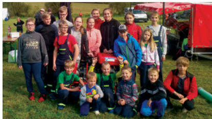
Soutěž v Libčici