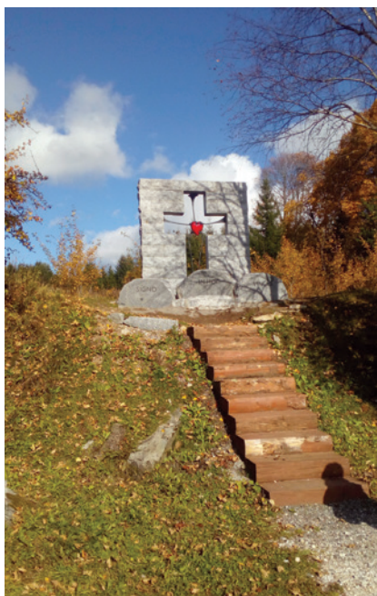
Zájezd na Šumavu 2019