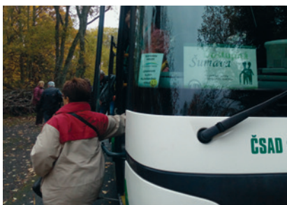
Zájezd na Šumavu 2019