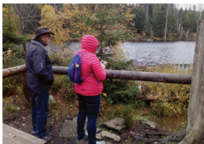
Zájezd na Šumavu 2019

A pro ty, kteří se s námi vydávají na pravidelné zájezdy alespoň obrazová vzpomínka na loňský zájezd na Šumavu. Letos je v plánu cesta na Ještěd a do Liberce, tak snad nám to vyjde.