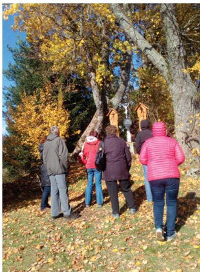
Zájezd na Šumavu 2019