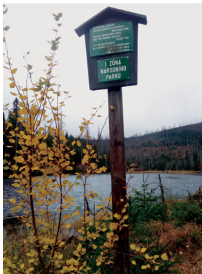
Zájezd na Šumavu 2019