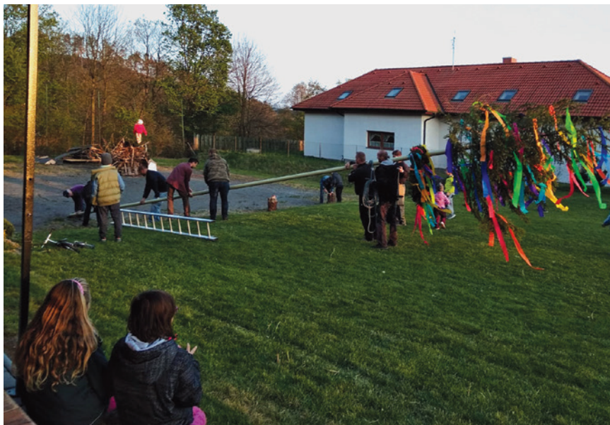
Stavění májky 2019

Nadále chceme v průběhu roku vylepšovat naši hasičskou zbrojnicu. Pokud to bude jen trochu možné, chtěli bychom se v květnu zúčastnit okreskové soutěže a první červnový víkend doufáme, že vyrazí tatínci se svými dětmi na Častoboř. 20. června 2020 proběhne pouťové odpoledne, kde se představí naše děti s ukázkou hasičského sportu a od dospělých hasičů se možná dočkáme nějakého překvapení. Na konci června bývá v Nečíně dětská soutěž o putovní pohár starosty a ten bychom chtěli opět vrátit zpět k nám. V srpnu pokud se nám podaří složit tým, vyrazíme do Staré Hutě. V září se chceme zúčastnit soutěže v Libčici, kde bychom chtěli vylepšit loňské umístění. Na této soutěži nás podpořily i naše ženy, které až na místě utvořily družstvo a bez přípravy vybojovaly