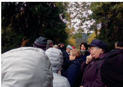
Zájezd na Šumavu 2019