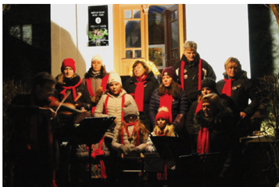
Rozsvěcení vánočního stromu