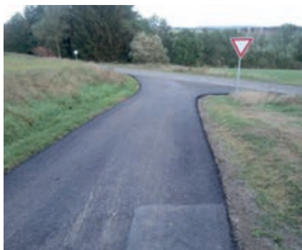
křižovatka do Hory