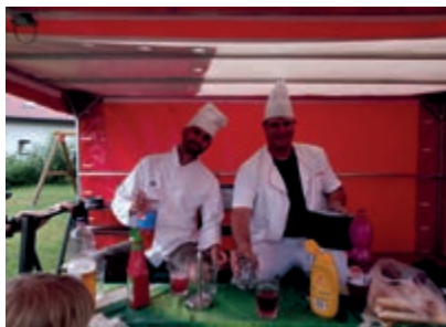
Pouťové odpoledne (scénka starších hasičů)