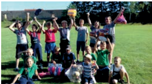
soutěž Nečín (zpríjemnění pro děti)