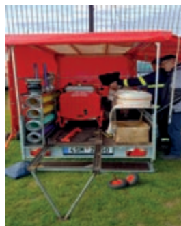
Nový vozík pro SDH