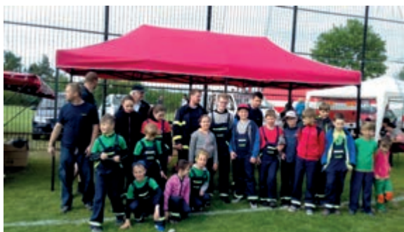
Okrsková soutěž Hřiměždice 2019

Milý spoluobčané, náš hasičský sbor chce přispět malými střípky do obecního zpravodaje. Na konci března jsme se sešli u hasičské zbrojnice na prvním tréninku. Z dětí, které přišly, jsme sestavili dvě družstva starších žáků a jedno družstvo mladších žáků (děti do 10 let). Každou neděli probíhaly tréninky, na kterých děti zlepšovaly svoje dovednosti. V dubnu SDH zorganizovalo sběr železného šrotu, který přispěl do našeho rozpočtu. Dne 11. 5. 2019 proběhla okrsková soutěž v Hřiměždicích, na které jsme obsadili tři čtvrtá a jedno první místo. Starší žáci I s časem 21,65 sekund (1 místo), starší žáci II s časem 31,88 sekund (4 místo), naši nejmenší (4 místo) s časem 26,62 sekund a páni II (4 místo) za čas 25,82 sekund. Na soutěž jsme měli k dispozici již zmiňovaný nový vozík, upravený na převoz hasičské techniky a rozkládací stan, který nám zpříjemnil soutěže při špatném počasí.