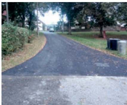
u kapličky v Ouběnicích, okolo bývalého statku