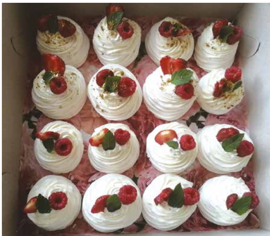
Vítězné dortíky Mini Pavlova