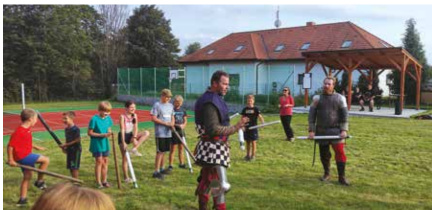
Loučení s létem