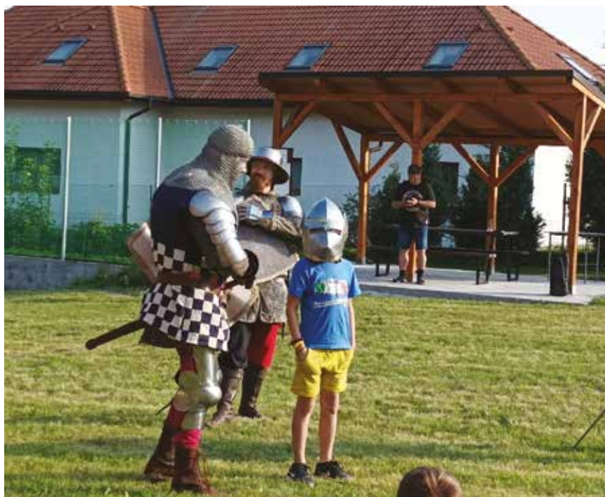
Loučení s létem