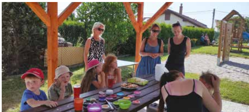
Malování na obličej