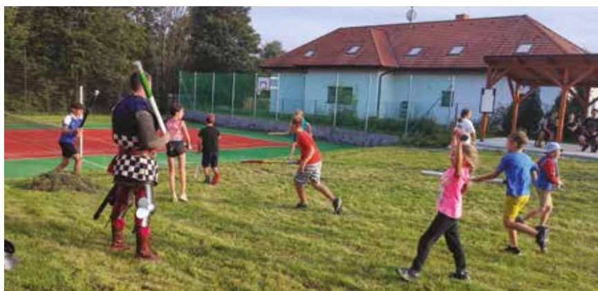
Loučení s létem