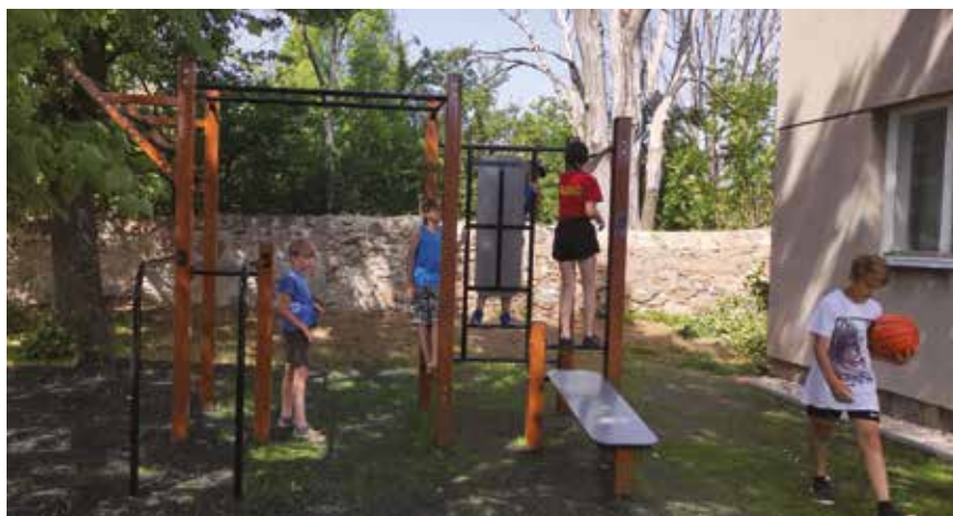
Nové workoutové hřiště

A tak si můžeme říci, že letošní pouťové odpoledne, ale i večer se nám opět vydařily. Příští rok v červnu nás však čeká nejen pouťové odpoledne, ale i oslavy 100 let samostatné obce Ouběnice a setkání rodáků. Plánovaný termín je 24.června 2023.