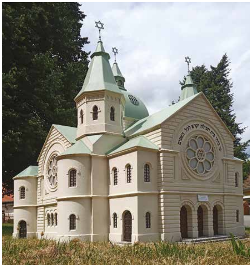
Synagoga v Ouběnicích