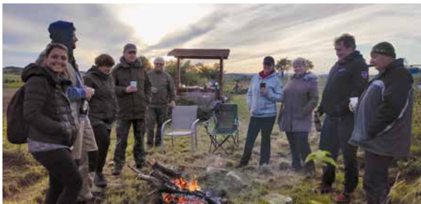
Sousedské setkání u altánu 28. 9. 22