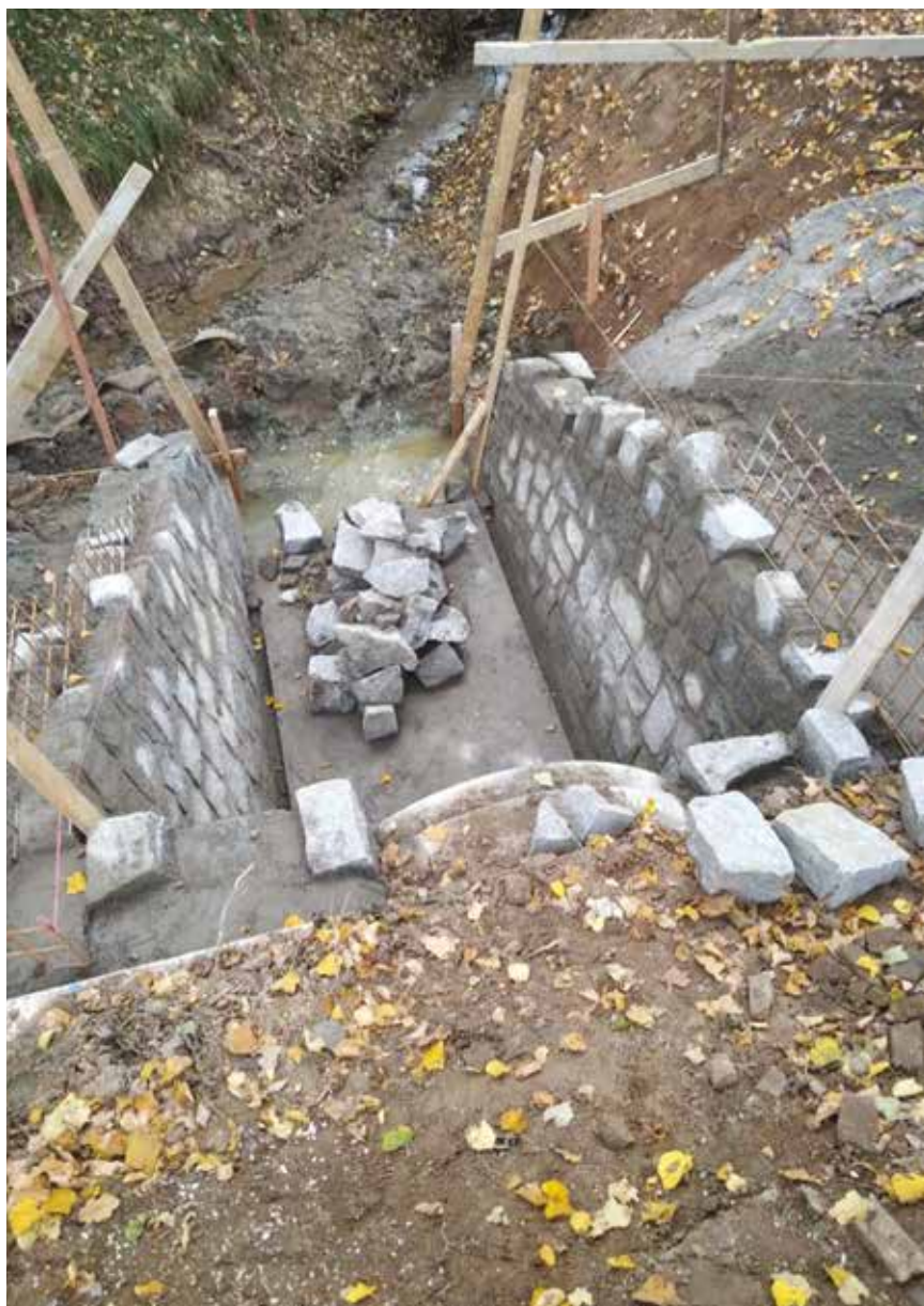
Revitalizace rybníka Splavěcí