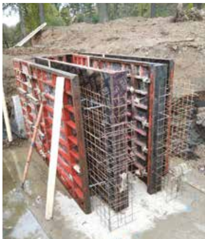
Revitalizace rybníka Splavěcí