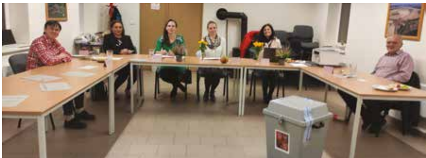
Volební komise Ouběnice