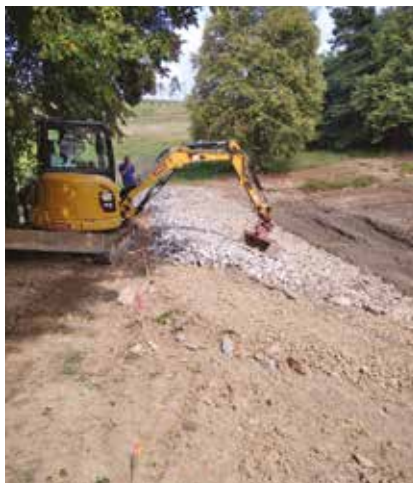
Revitalizace rybníka Splavěcí