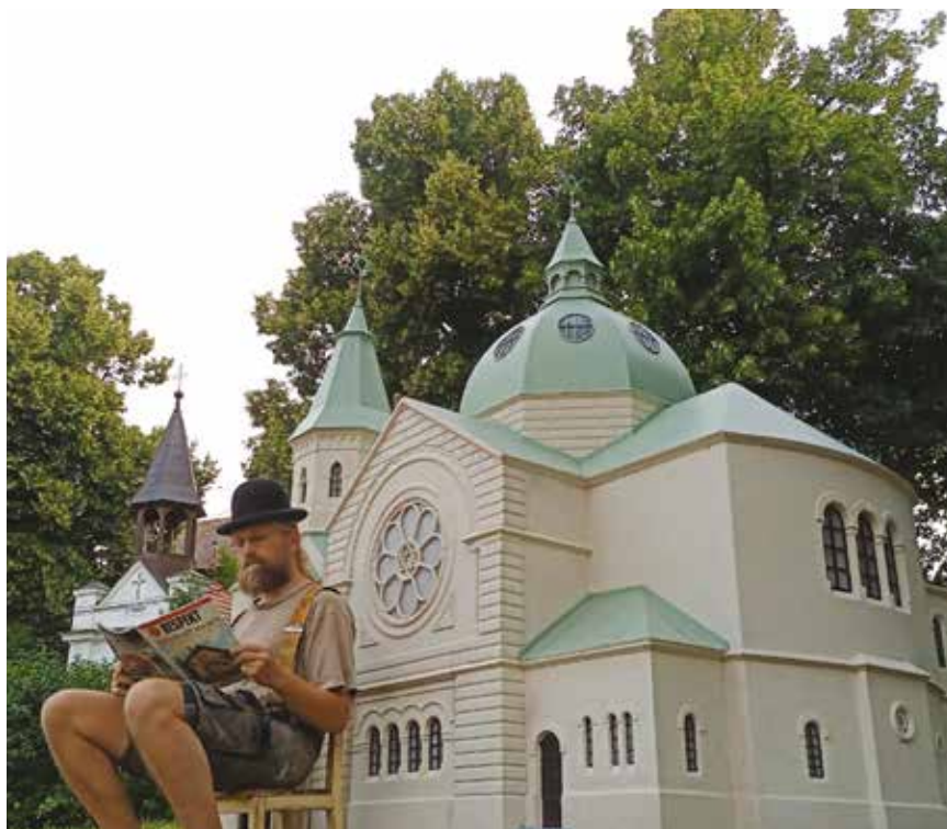
Autor a jeho dílo

https://www.krestandnes.cz/lide-si-v-kromerizi-mohou-prohlednout-velky-model-znicene-synagogy/