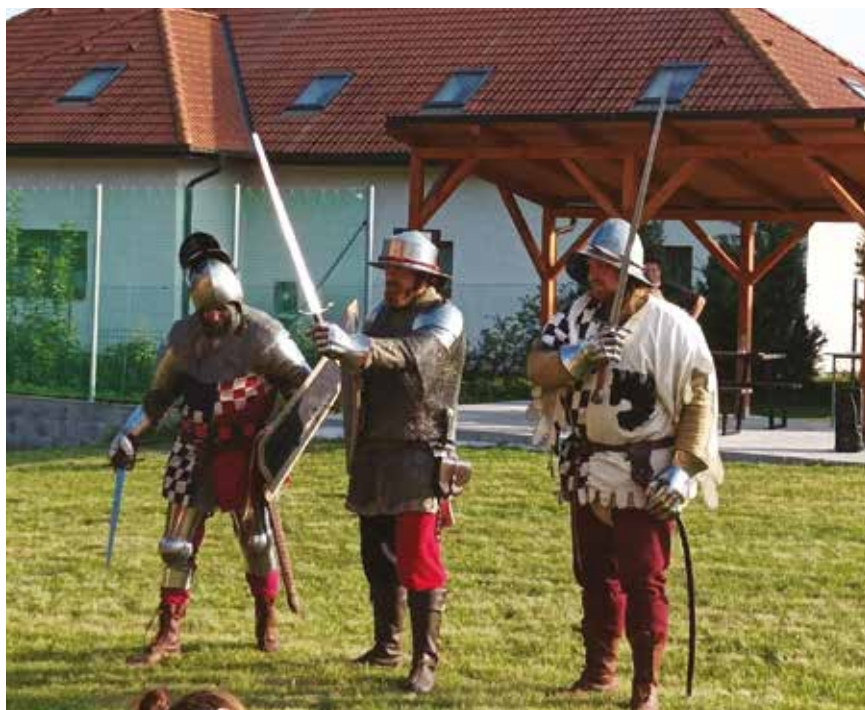
Loučení s létem