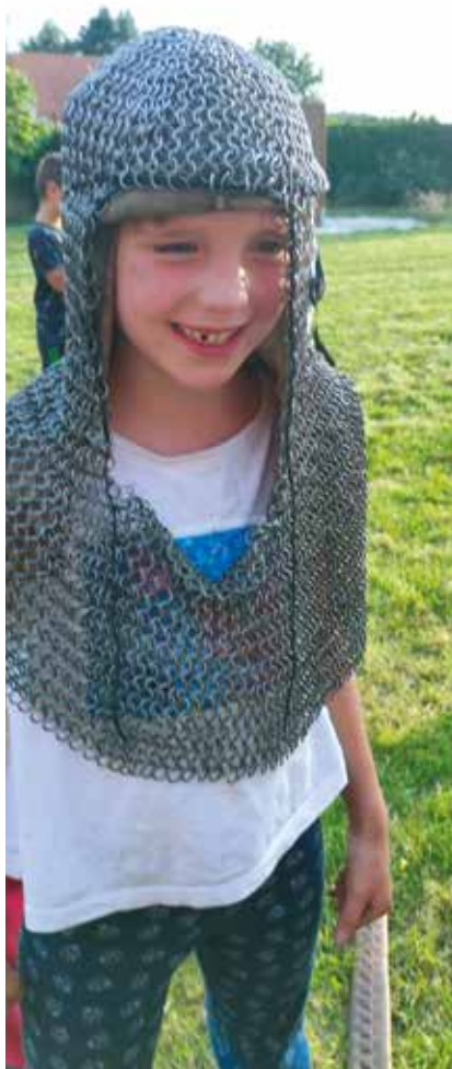
Loučení s létem