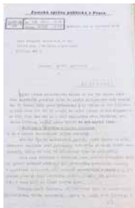
Schválení samostatné obce Ouběnice