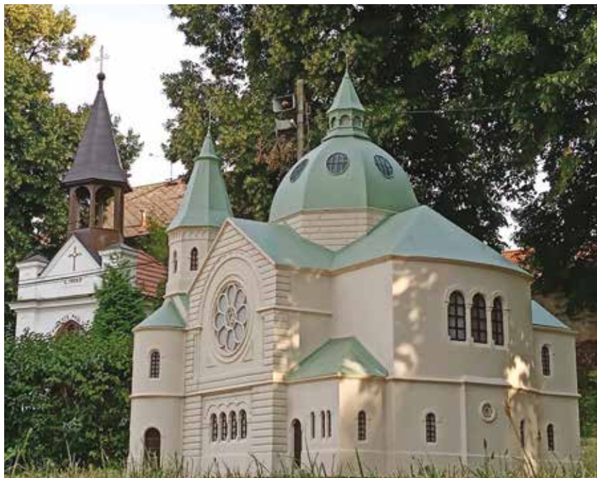
Synagoga v Ouběnicích

(Tento text je převzat z webu příbram.cz , pouze došlo k malému upřesnění – slova umělec z Dobříše, jsme opravili na umělec z Ouběnic, což odpovídá skutečnosti)