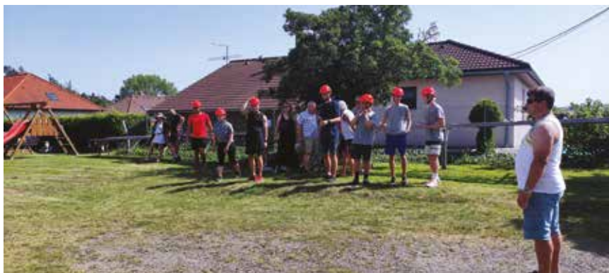
Ukázka hasičských dovedností

Od 18ti hodin se konala před kapličkou v Ouběnicích mše svatá, které se zúčastnili jak místní obyvatelé, tak mnozí přespolní.