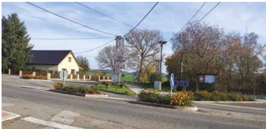
Chodníky Ostrov listopad 22

Asi není nutné vysvětlovat, že Ostrov je velice zatížen tranzitní dopravou - nejen osobních automobilů, ale i těžkých nákladních vozidel a zemědělských strojů. Počet projíždějících vozidel se kontinuálně zvyšuje a především v brzkých ranních hodinách a v pátek a v neděli odpoledne je intenzita provozu největší.