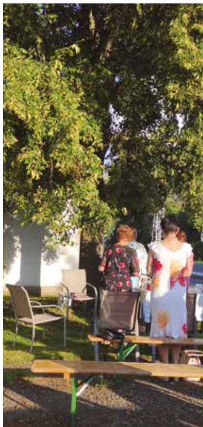
Mše u kapličky Ostrov