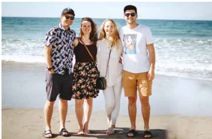
Setkání na Novém Zélandu