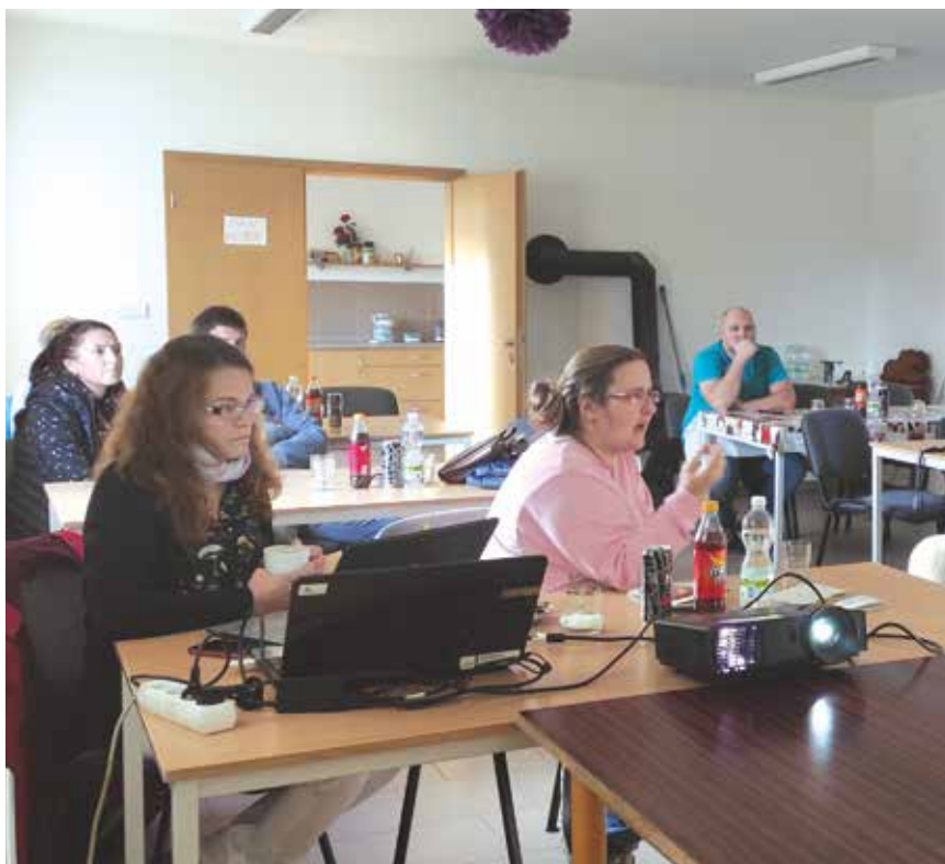
Setkání občanů – plán rozvoje obce

v souladu s požadavky občanů. Aby byl Plán rozvoje obce Ouběnice platný, musí být schválený zastupitelstvem obce. Před tím však bude jeho verze zveřejněna na webových stránkách obce, aby se s tímto dokumentem mohli seznámit i ti z vás, kteří se nemohli veřejné schůze zúčastnit. Bude zde rovněž připomínkový formulář, aby občané mohli uplatnit případné připomínky. Předpokládaný termín zveřejnění na webových stránkách obce je začátek listopadu. Připomínky je možné uplatňovat do 17. 11. 2023.