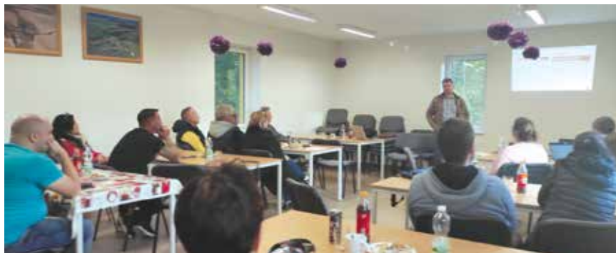
Setkání občanů – plán rozvoje obce

25.10. se konala druhá veřejná schůze, na které starosta obce představil konkrétní záměry obce pro období 2024 – 30. Děkujeme všem zúčastněným, kteří svými připomínkami přispěli k tomu, aby záměry obce byly