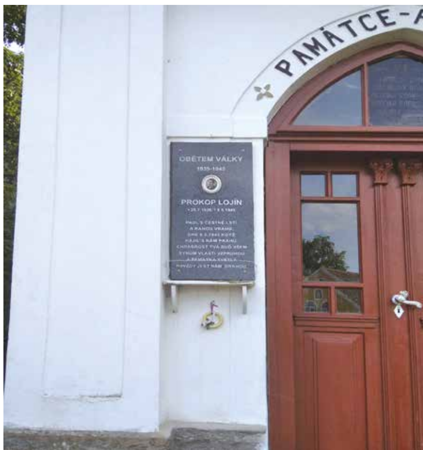
Obnova pamětní desky

Před oslavou stého výročí samostatnosti obce Ouběnice rozhodlo zastupitelstvo o renovaci jediného pietního místa v obci. Jedná se o pamětní desku oběti 2. světové války připevněné na stěně kapličky Panny Marie v Ouběnicích. Vzhledem ke špatnému stavu jsme se rozhodli nikoli pro opravu, ale výměnu pamětní desky. Vše proběhlo před poutí a všímaví jedinci jistě tuto změnu zaznamenali.