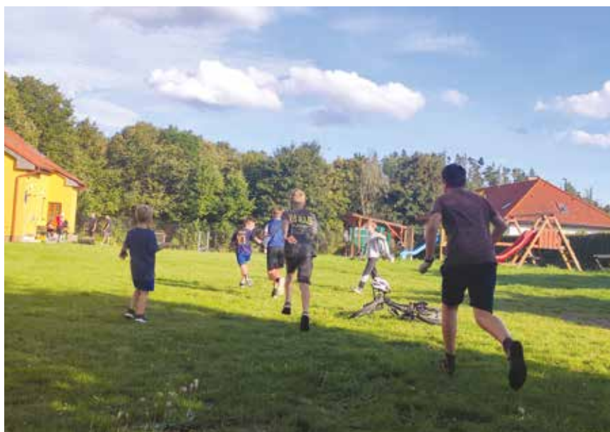
Loučení s létem