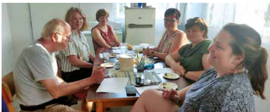
Odborná porota pekařské soutěže