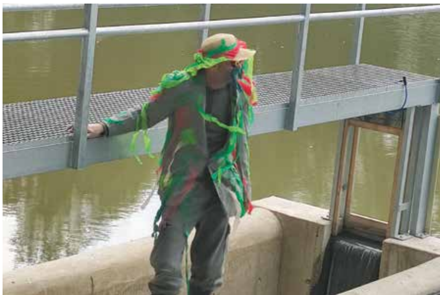
Vodník se vrátil na své působiště