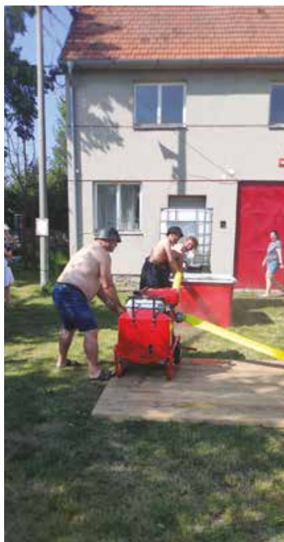
Hasiči v akci