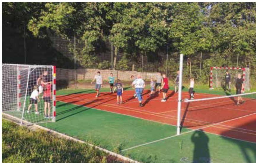
Loučení s létem, sportovní zápolení