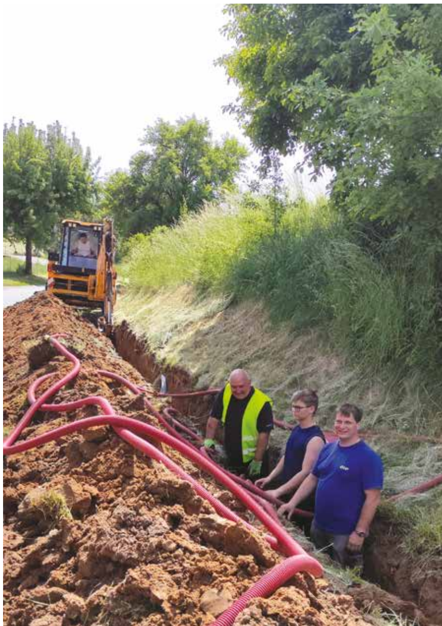
Stavba nového osvětlení