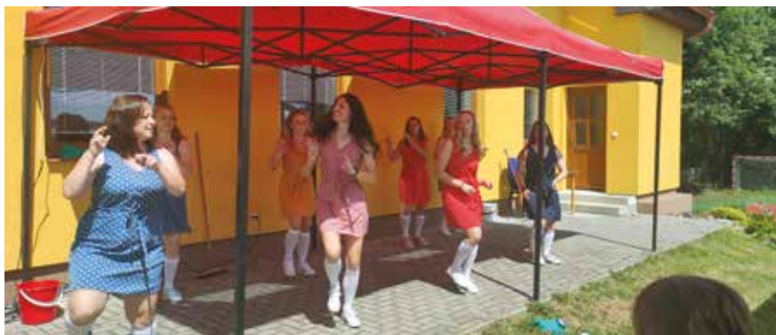
Taneční vystoupení žen a dívek