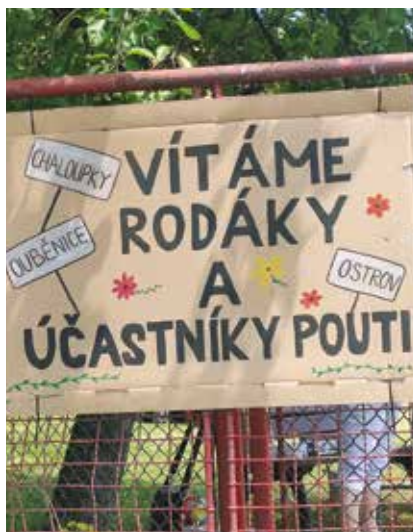
Pouť 2023 plakát