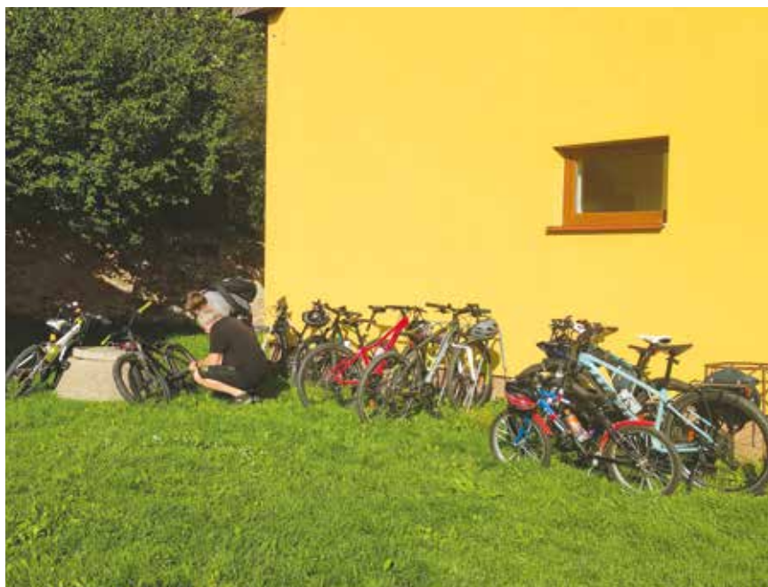
Loučení s létem, parkoviště cyklistů

Letos jsme se společně loučili s létem první sobotu v září a tento den jsme pojali sportovně. Začali jsme cyklovýletem z Ouběnic na Chaloupky a potom přes oborský les jsme se stočili zpátky k Ouběnicím. Ujeli jsme cca 15 km. Na začátek hezký výkon. Ti, kteří se nevydali na cyklovýlet, se připojili později. Na hřišti jsme potom pokračovali hraním basketu, nohejbalu a došlo i na fotbálek. Hrál se s takovým nasazením, že po jednom kopnutí skončil míč až na stole s občerstvením. Naštěstí to dobře dopadlo. S chutí jsem si jako vždy dali párky v rohlíku a buřty s chlebem.