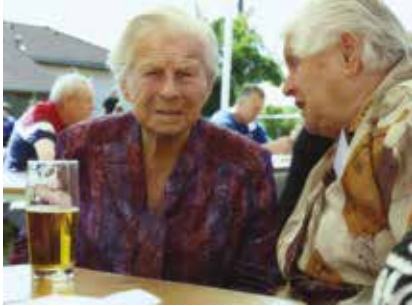
Setkání rodáků při pouti