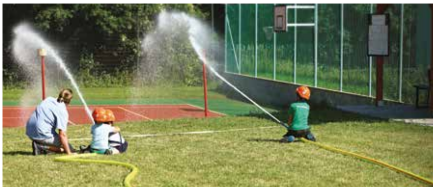
Naši nejmladší hasiči