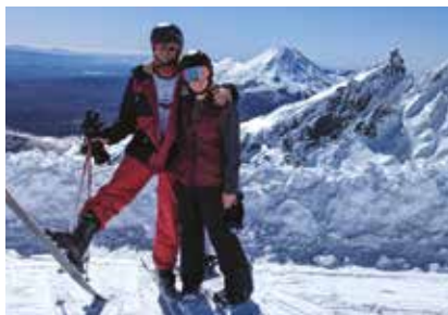
na Novém Zélandu