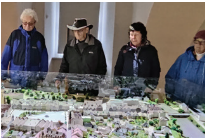
Plán města Havlíčkův Brod