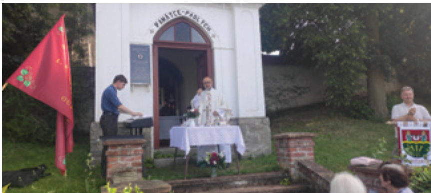
Svěcení znaku obce a hasičského praporu