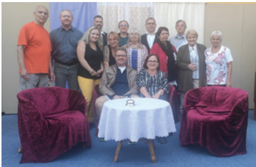
Divadelní soubor z Bystřice