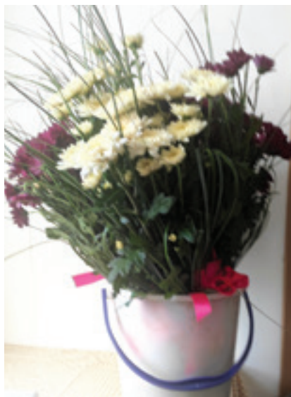
Setkání ouběnických žen