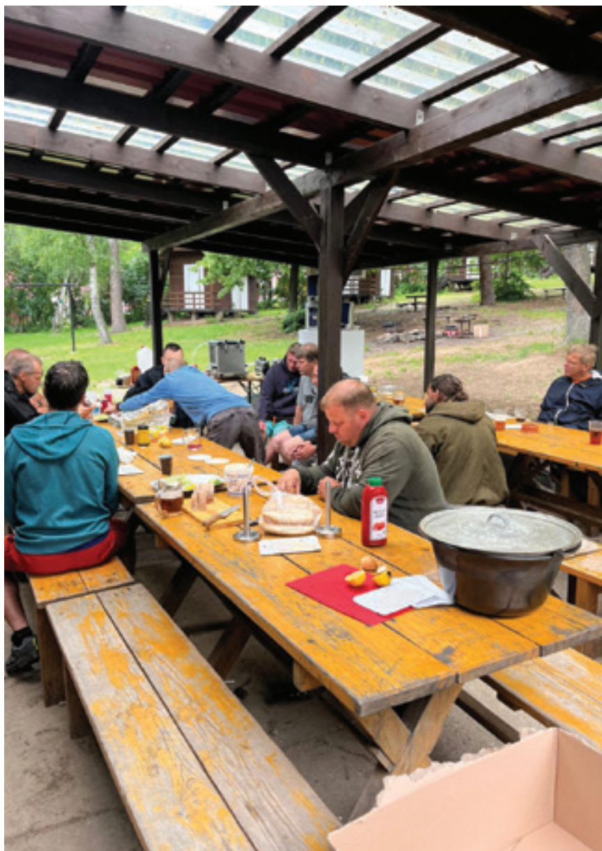
Víkend na Častoboři