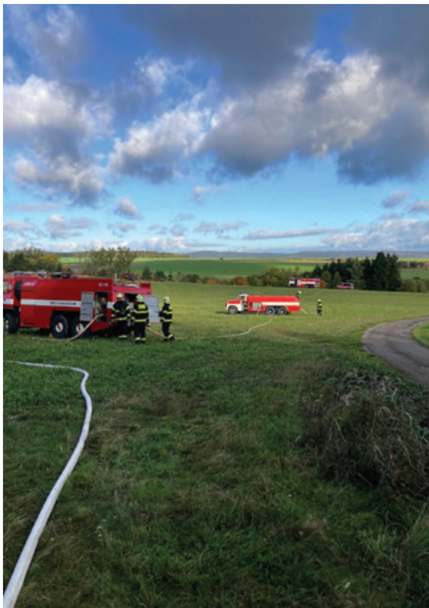
Ouběnice - námětové cvičení