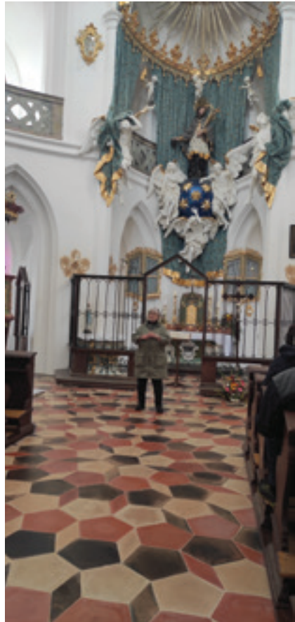
Interiér kostela na Zelené hoře