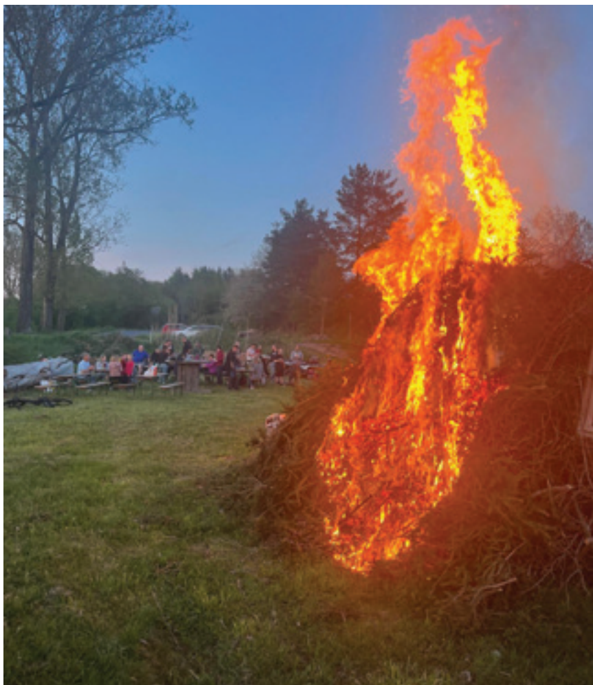
Ouběnice - pálení čarodějnic