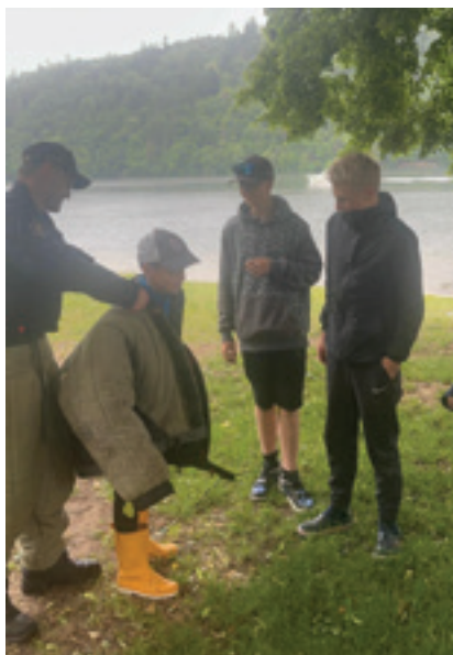
Víkend na Častoboři

Začátkem června jsme se jako každý rok vypravili na otcovský víkend s dětmi na Častoboř. Víkend probíhal tradičně, jen nám zase moc nepřálo počasí, a tak jsme si nemohli plně užívat oblíbené vodní hrátky. Mladí rybáři rozložili svá ležení u řeky a téměř celý víkend se od ní nevzdálili. Nechyběl tradiční bobřík odvahy, který zahájil náš legendární vodník. Nechybělo ježdění na lodích, opékání buřtů a naši rybáři nám připravili k jídlu jejich úlovky. V sobotu odpoledne dorazili na naše pozvání psovodi z policie, kteří nám udělali velmi zajímavou přednášku s praktickou ukázkou výcviku policejních psů. I přes nepřízeň počasí se i letošní Častoboř vydařila a už se zase těšíme na tu příští.