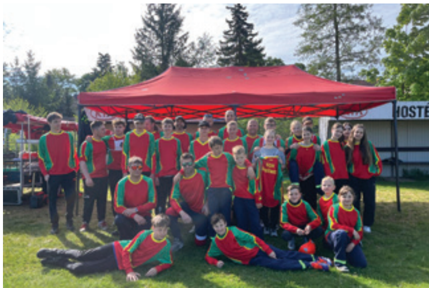
Hasiči v nových dresech

Během jara jsme opět pilně trénovali na okrskovou soutěž, která se letos konala 10.května ve Višňové. Na soutěž jsme přihlásili 4 družstva – mladší žáky, starší žáky, muži a muži 35+. Oblékli jsme naše nové dresy a šli vybojovat co nejlepší výsledky. Mladší žáci se se skvělým časem 22,93s umístili na úžasném 1. místě, druzí byli žáci z Hříměždic a třetí místo bral náš rival ze Skalice. Neméně úspěšně soutěžili našistarší žáci, které dosáhli také skvělého času 25,2 s, což jim zajistilo 2. místo . Zlato brala Skalice a bronz Hříměždice. Na úžasné výkony našich dětí se pokusili navázat i muži. Mladší muži zužitkovali zkušenosti nabrané na loňské soutěži, která byla pro většinu členů týmu první v této kategorii. Letos si o dvě místa polepšili a skončili na krásném 5.místě. Pevně věříme, že jejich zlepšování bude pokračovat i příští rok. Mužům 35+ se letos moc nedařilo a skončili na 7. místě. Všem našim členům, kteří se soutěže zúčastnili, děkujeme za jejich přístup.