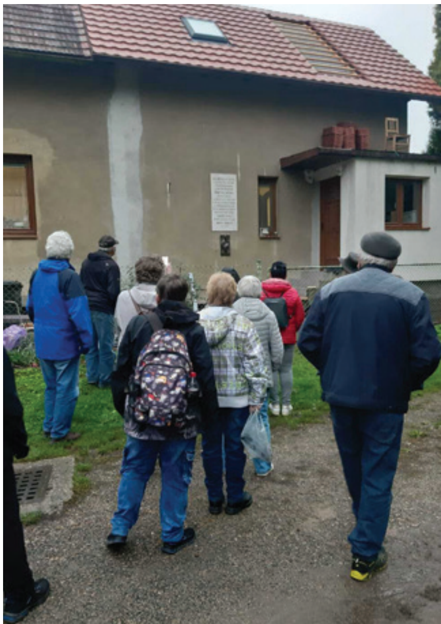
Vaňkův statek s pamětní deskou