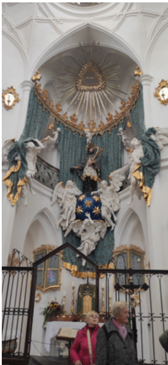
Kostel na Zelené Hoře