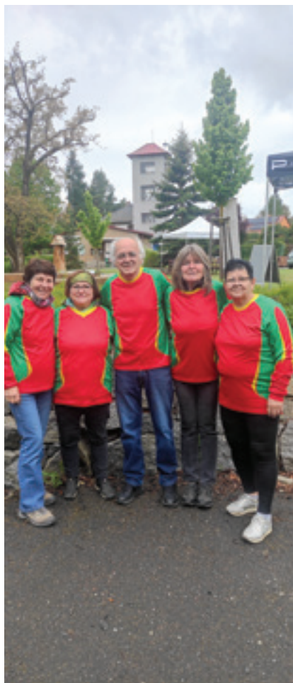
Družstvo reprezentující Ouběnice