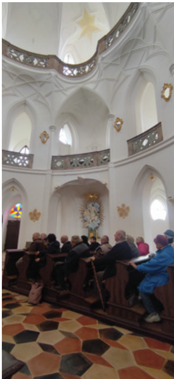
Kostel na Zelené hoře