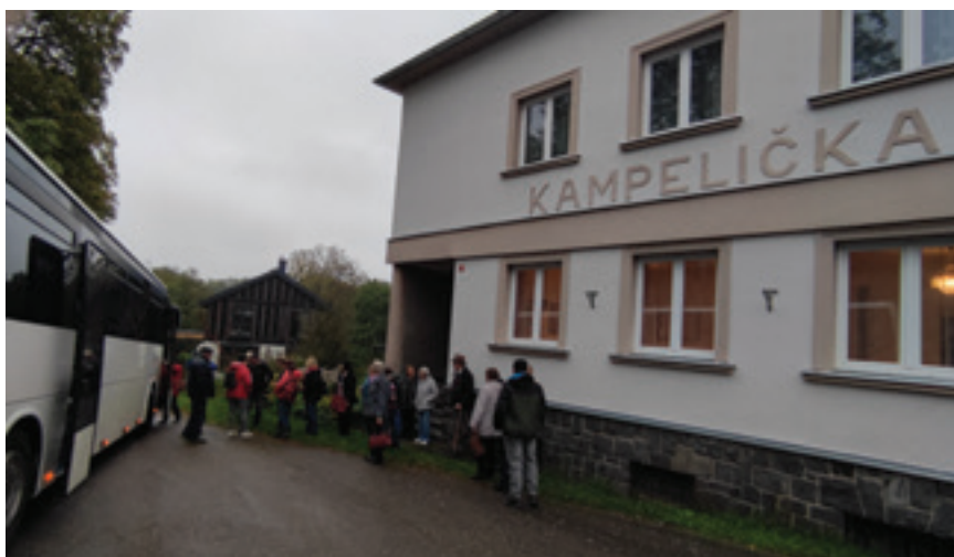
Příjezd autobusu na návštěvu Ouběnic