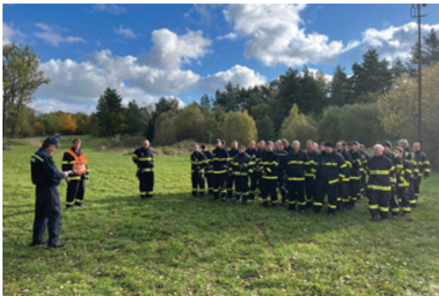
Námětové cvičení - Ouběnice závodiště