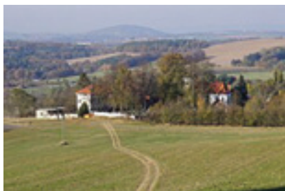
Interiér kostela na Zelené hoře

První písemná zmínka o vesnici pochází z roku 1327. Původní tvar jména vsi zněl „Albinici“, tedy lidé Albinovi, z toho vzniklo „Auběnice“; „au“ se četlo jako „ou“ a později se tomu přizpůsobila i psaná forma. Ve středověku zde stávala tvrz, zemanské sídlo, která zpustla počátkem 15. století. Ouběnice byly poddanskou vesnicí. Obyvatelé se živili většinou zemědělstvím