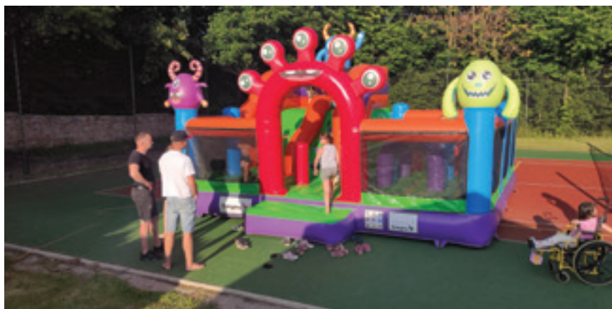
Pouťový skákací hrad